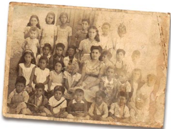
Grupo de 1er Año Esc. Sec. Benito Juárez (1948)

Recordar la escuela trae a la memoria el nombre de los compañeros de clase: algunos que se fueron y no volvieron a saber de ellos, otros que ya murieron y los que aún viven; se aprecia la admiración a aquellos que sobresalieron porque tenían dinero y continuaron sus estudios en Monterrey o Cadereyta, – “ los pobres nomás íbamos dos o tres años y a veces nos sacaban para ir a trabajar a la siembra o a cuidar las cabras, aún que nos gustara la escuela había otras cosas mas importantes como comer y ayudar a nuestra familia; andábamos descalzos, con parches en la ropa, se acuerda uno y le dan ganas de llorar” –.