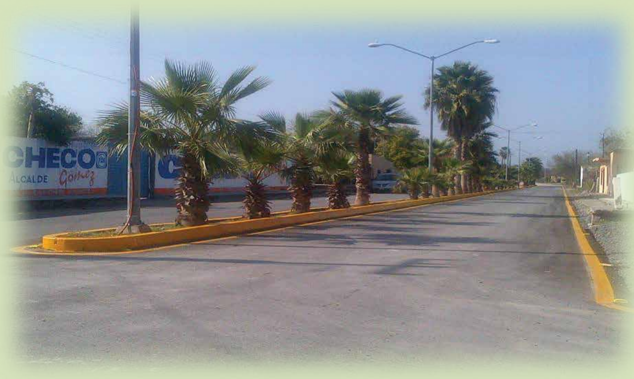
Repavimentación del Boulevard Juan Ignacio Ramón en Cabecera Municipal Una Obra más de esta Administración