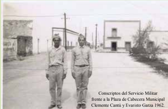
Conscriptos del Servicio Militar frente a la Plaza de Cabecera Municipal Clemente Cantú y Evaristo Garza 1962.