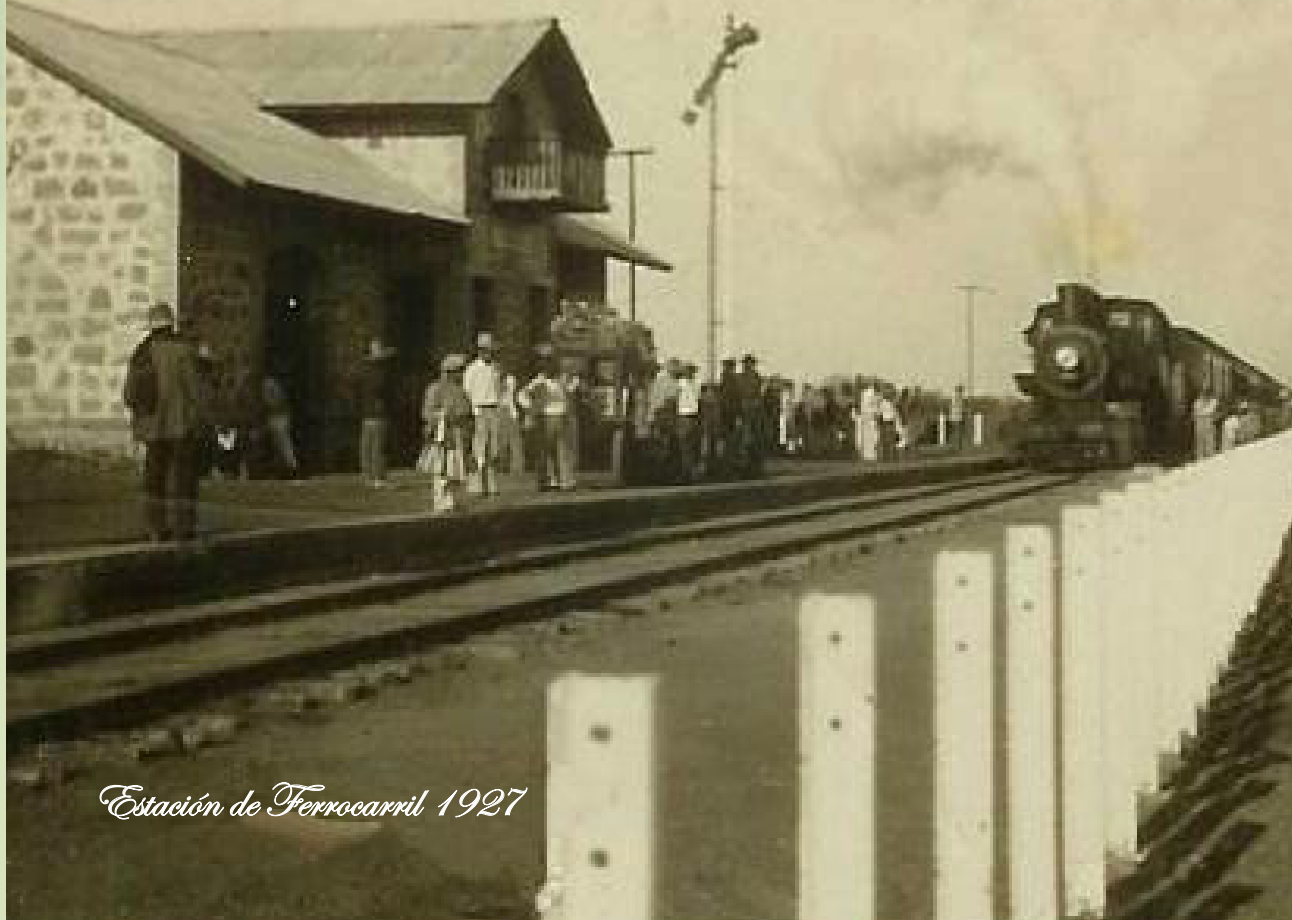
Estación de Ferrocarril 1927