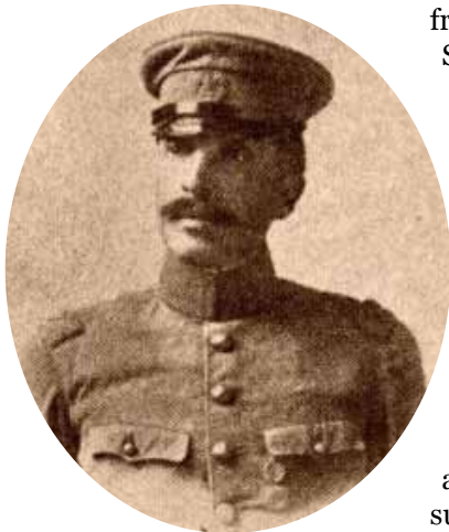
General Felipe Angeles

La guarnición del puente al mando del Teniente Domingo Zapiain antes que contestar los reclamos de los vecinos del pueblo, victimas del acoso de los revolucionarios y perseguirlos, se mantenía en su puesto y además exigían a las autoridades municipales